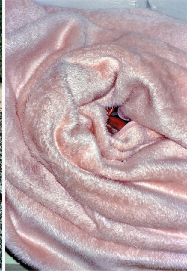
"shovel-eye" serisinden / From the series "shovel-eye", 2014-2017

Fine art kağıt üzerine arşivsel pigment baskı, diptik Archival pigment print on fine art paper, diptych 65 x 45 cm (her biri / each)