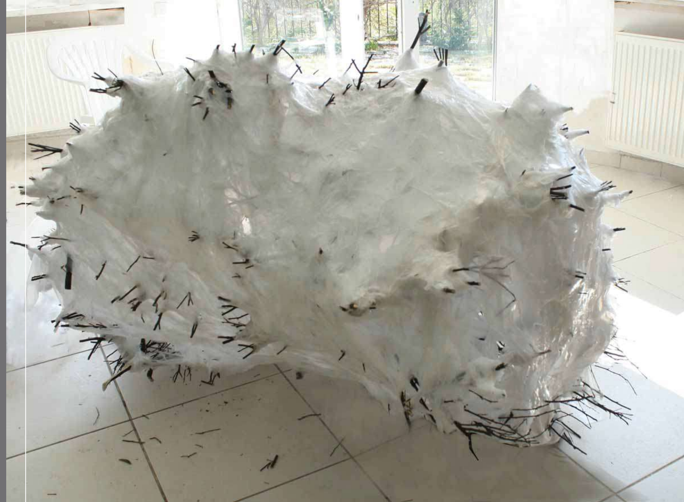
DIKENLİ BULUT 1 / THORNY CLOUD 1 81x188x110cm Heykel / Skulptur PVC, karışık teknik / PVC, mixed media, 2011