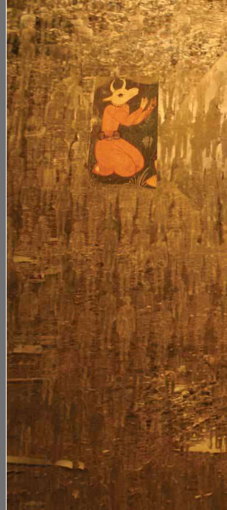
DUA EDEN MELEKLER / PRAYING ANGELS 200x255cm Triptik / Triptychon Tuval üzerine karışık teknik / Mixed media on canvas, 2011