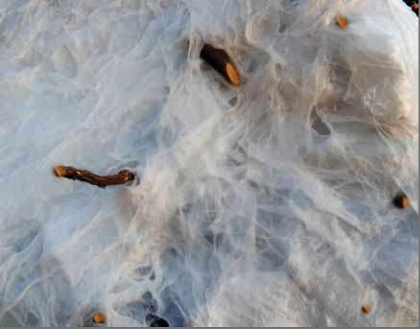
DİKENLİ BULUTLAR / THORNY CLOUDS 82x190x132cm Heykel / Skulptur PVC, karışık teknik / PVC, mixed media, 2011