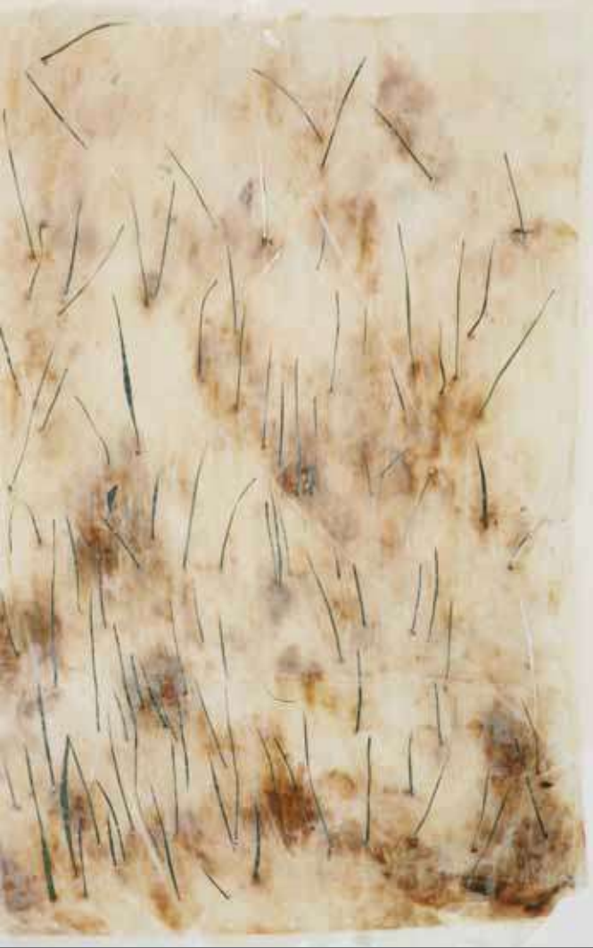
DERMİS / DERMIS 100x80cm Kağıt üzerine desen / Drawing on paper, 2008