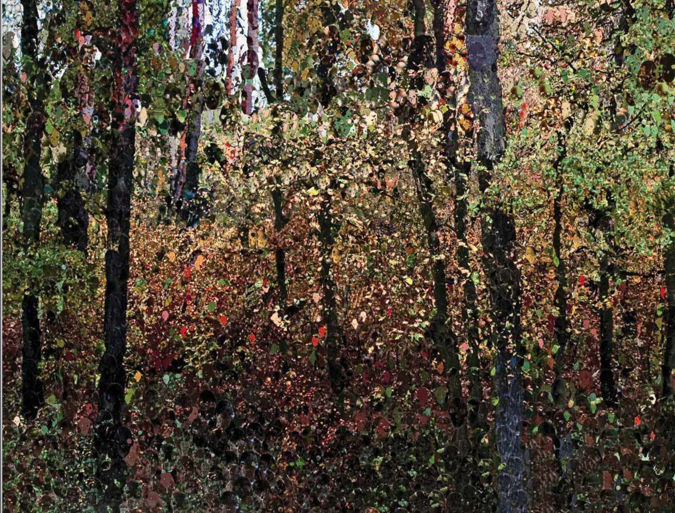
KUZEY ORMANI 2 / NORTHERN FOREST 2 156x230cm Panel üzerine karışık teknik / Mixed media on panel, 2011