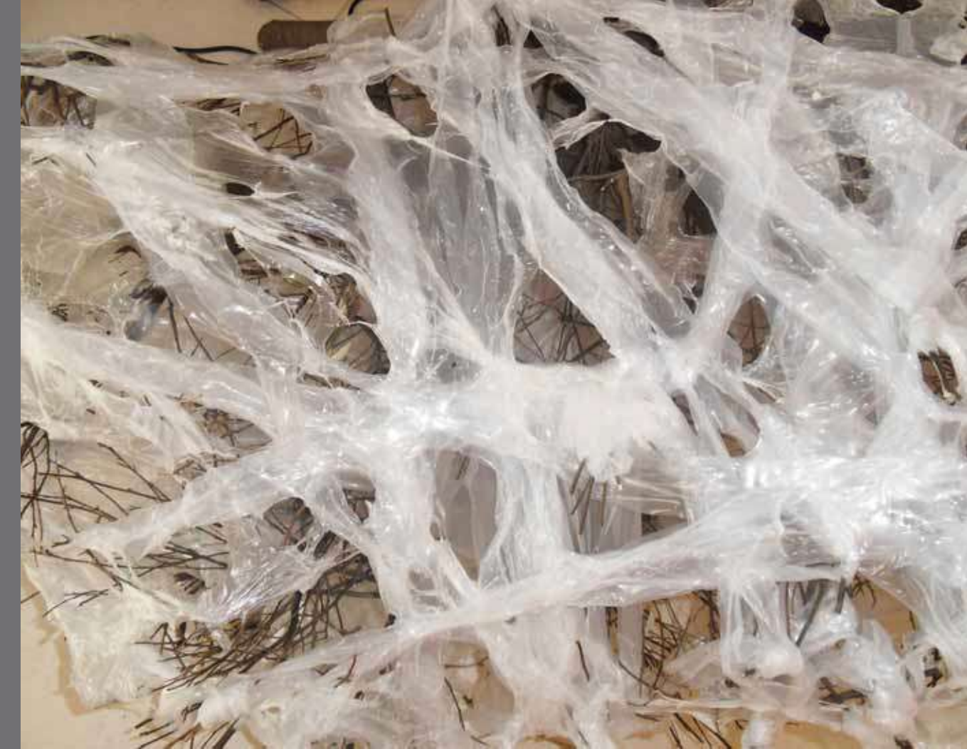
DIKENLİ BULUT (Detay) / THORNY CLOUD (Detail) Heykel / Skulptur PVC, karışık teknik / PVC, mixed media, 2011