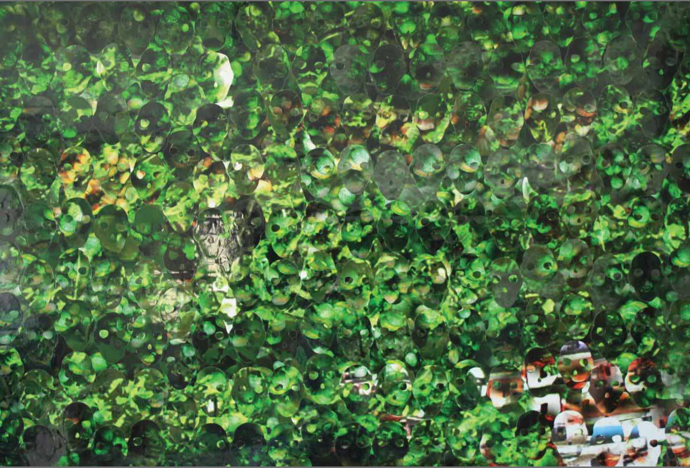
FINDIK BAHÇESİ 2 / GARDEN OF NUTS 2 135x195cm Tuval üzerine karışık teknik / Mixed media on canvas, 2011