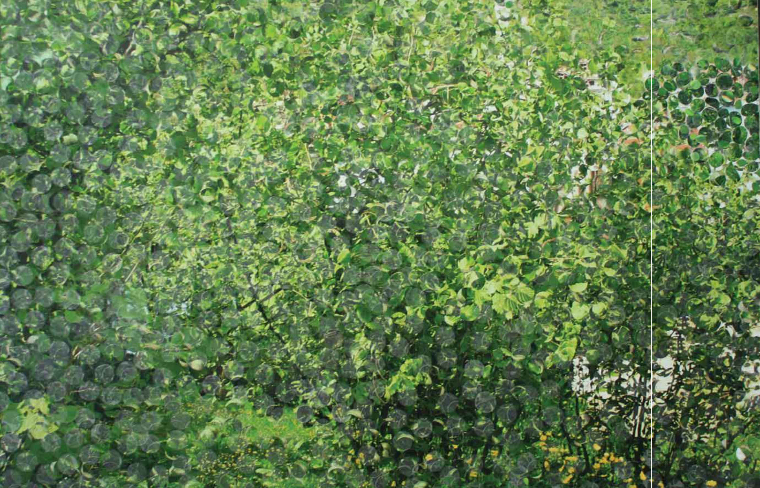
FINDIK BAHÇESİ / GARDEN OF NUTS 104x150cm Tuval üzerine karışık teknik / Mixed media on canvas, 2011