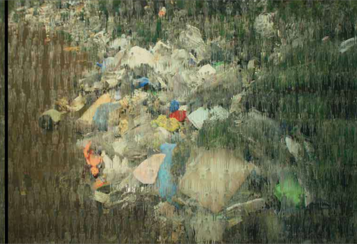
ÜÇÜNCÜ DOĞA / THE THIRD NATURE 135x600cm Triptik / Triptychon Tuval üzerine karışık teknik / Mixed media on canvas, 2011