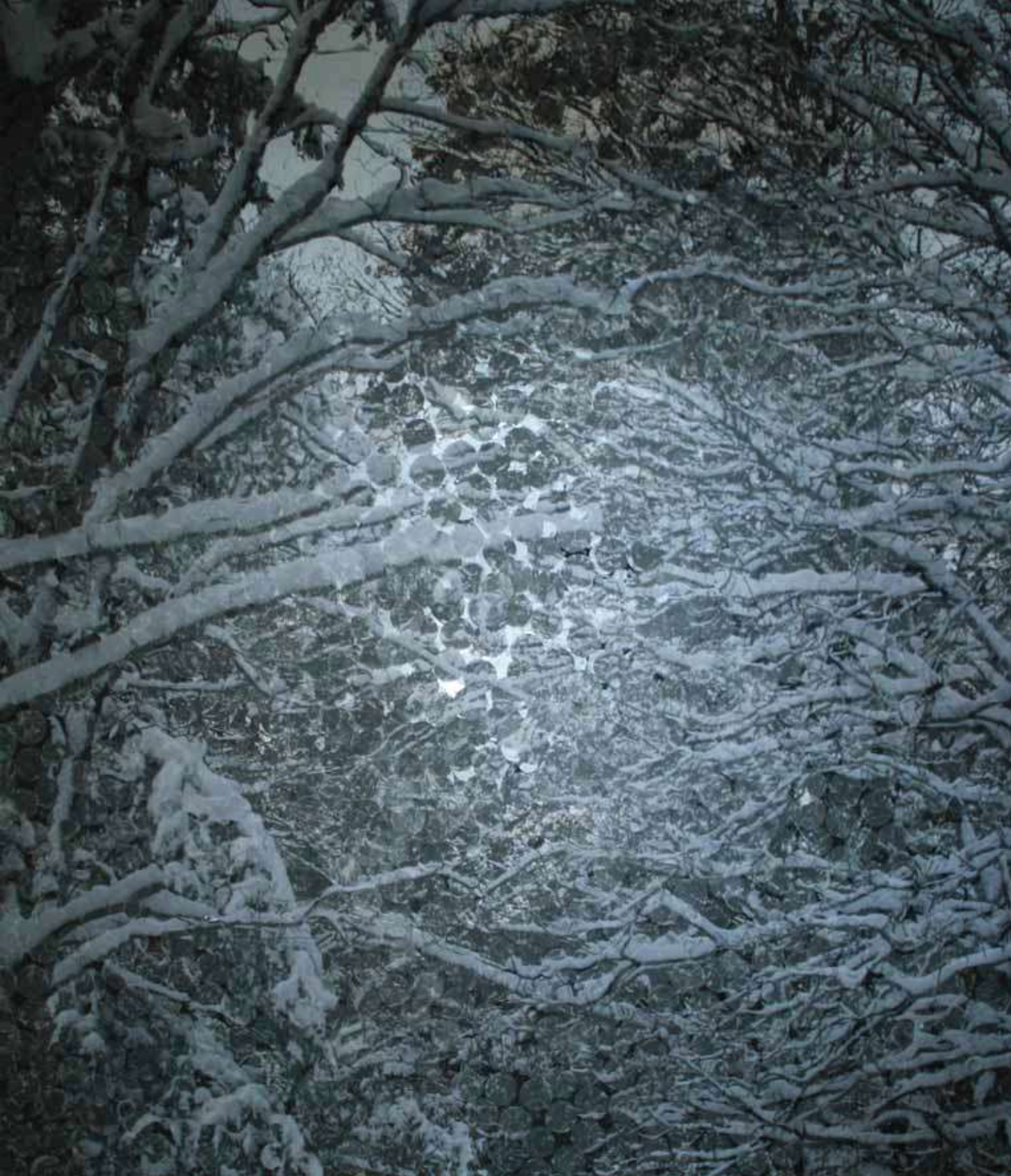
KARA KAR / DARK SNOW 250x210cm Panel üzerine karışık teknik / Mixed media on panel, 2011