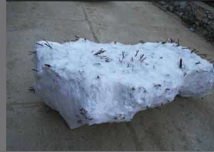
DİKENLİ BULUT 1 / THORNY CLOUD 1 81X188X110 Skulptur PVC, karışık teknik / PVC, mixed media, 2011