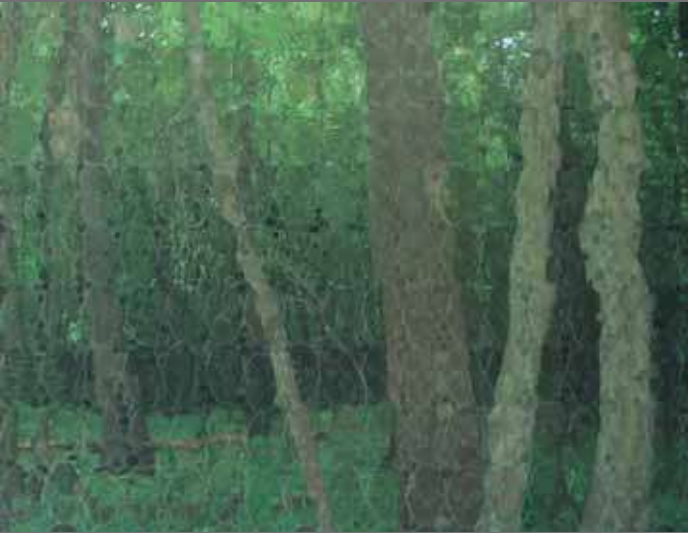
KARA ORMAN [Detay] / DARK FOREST [Detail]

Önceki sayfa / Previous page KUZEY ORMANI 2 / NORTHERN FOREST 2 156x230cm Tuval üzerine karışık teknik / Mixed media on canvas, 2011