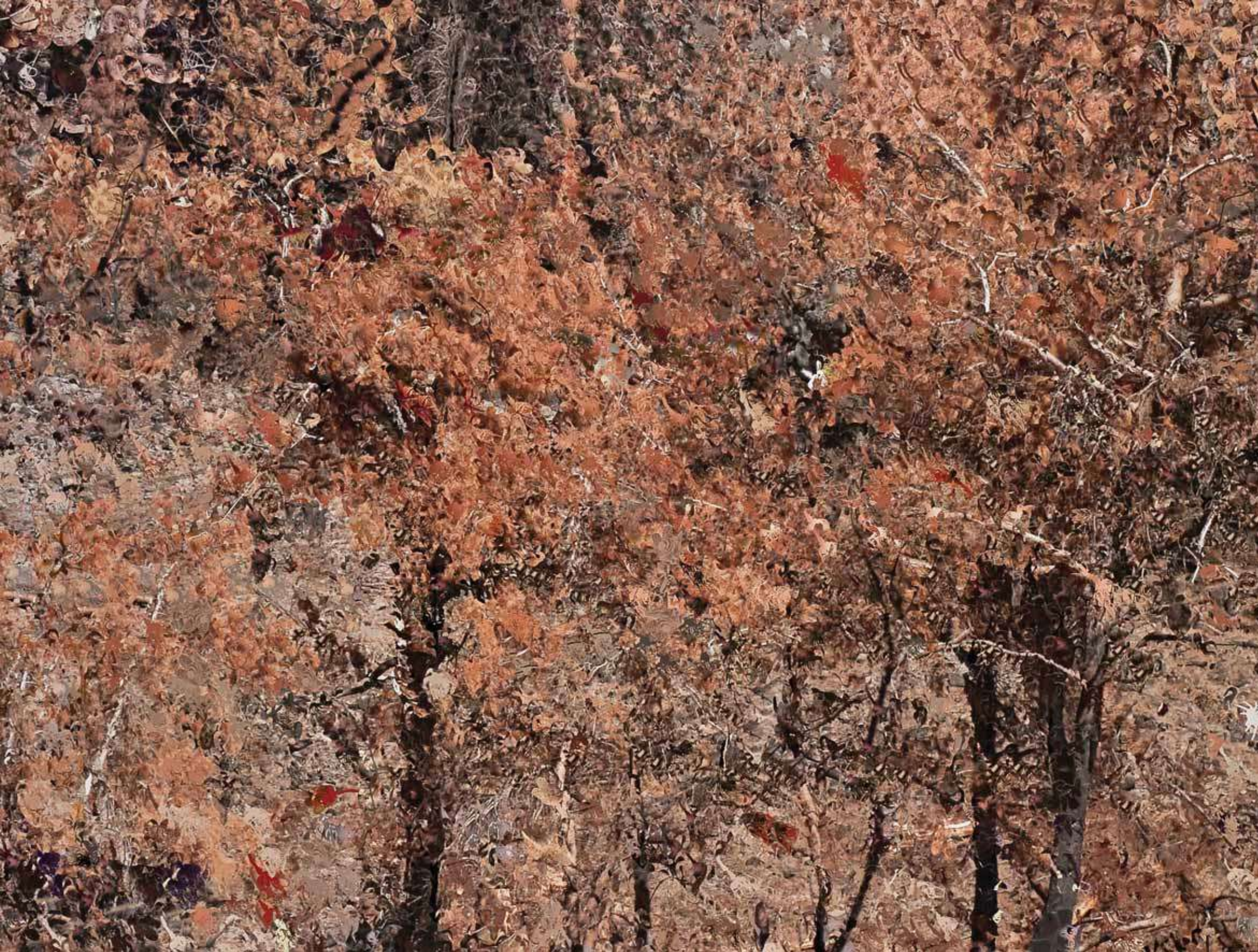
YANGIN 2 / FIRE 2 103x150cm Tuval üzerine karışık teknik / Mixed media on canvas, 2011