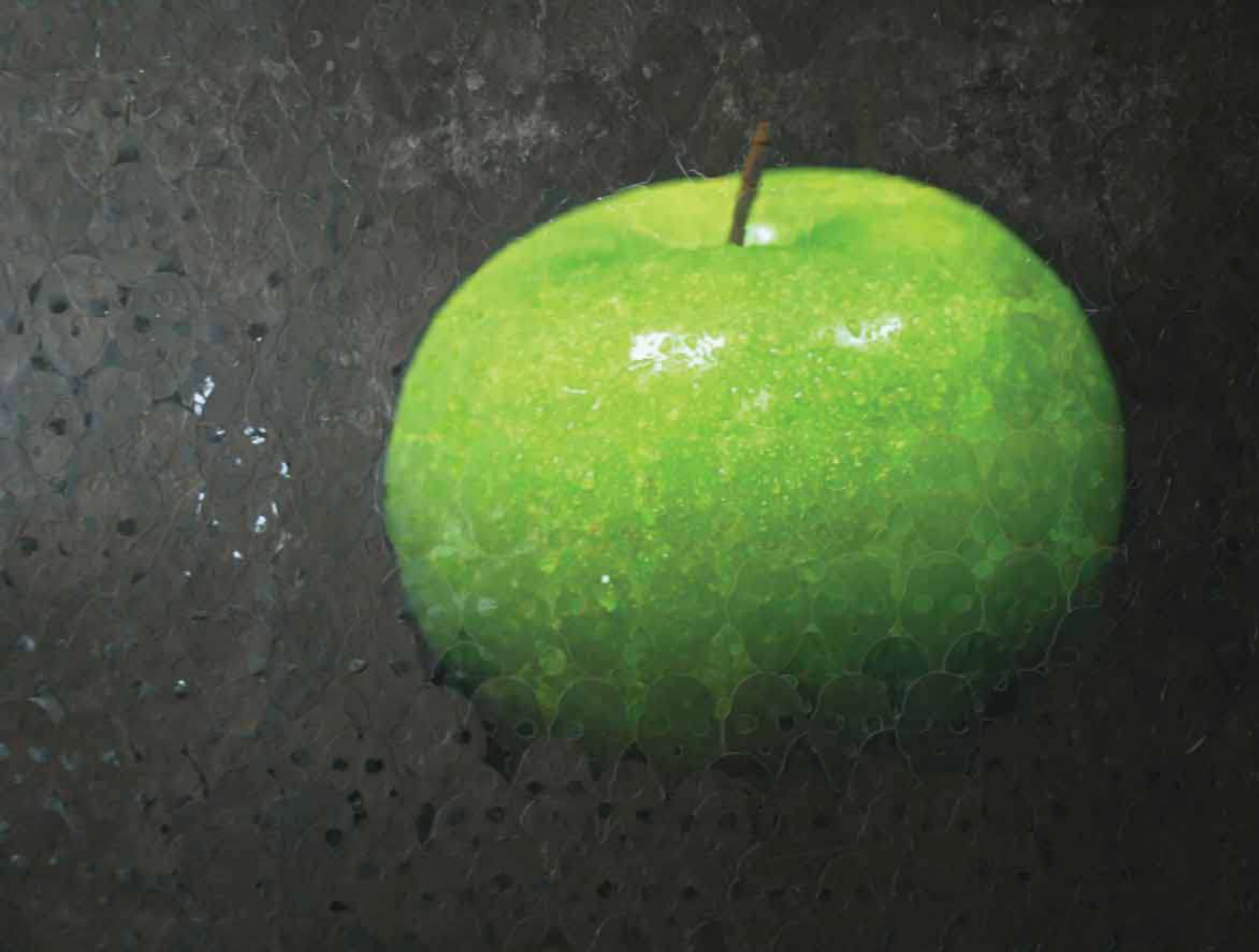
GÜNAH ELMASI / THE FALLEN APPLE 136x206cm Tuval üzerine karışık teknik / Mixed media on canvas, 2011