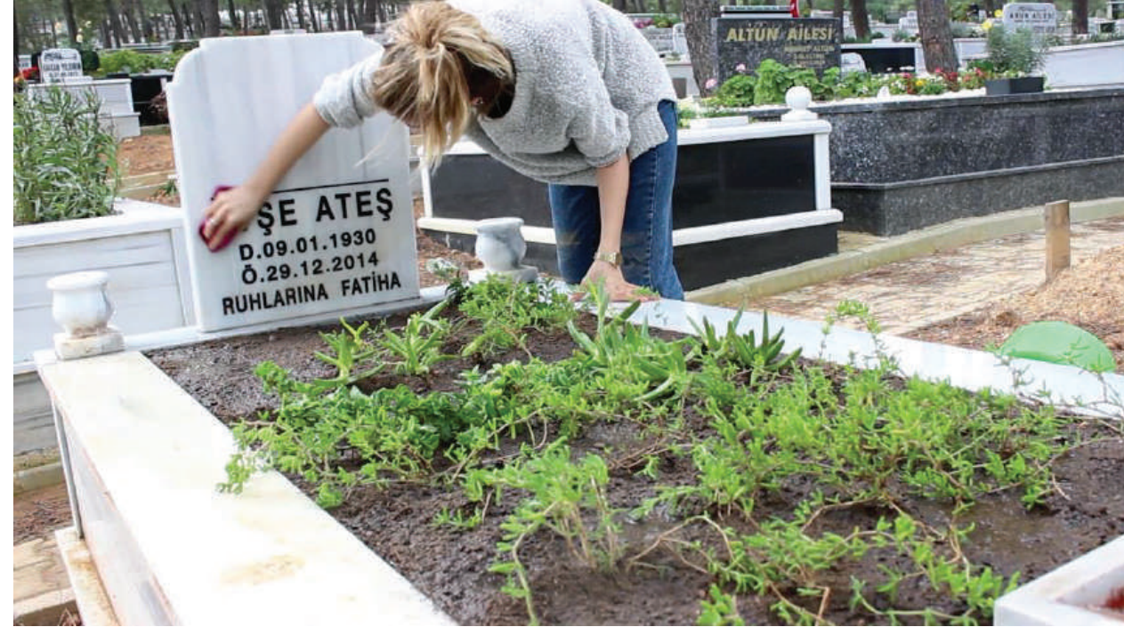
Taze Nane Sabunu / Fresh Mint Soap, 2017