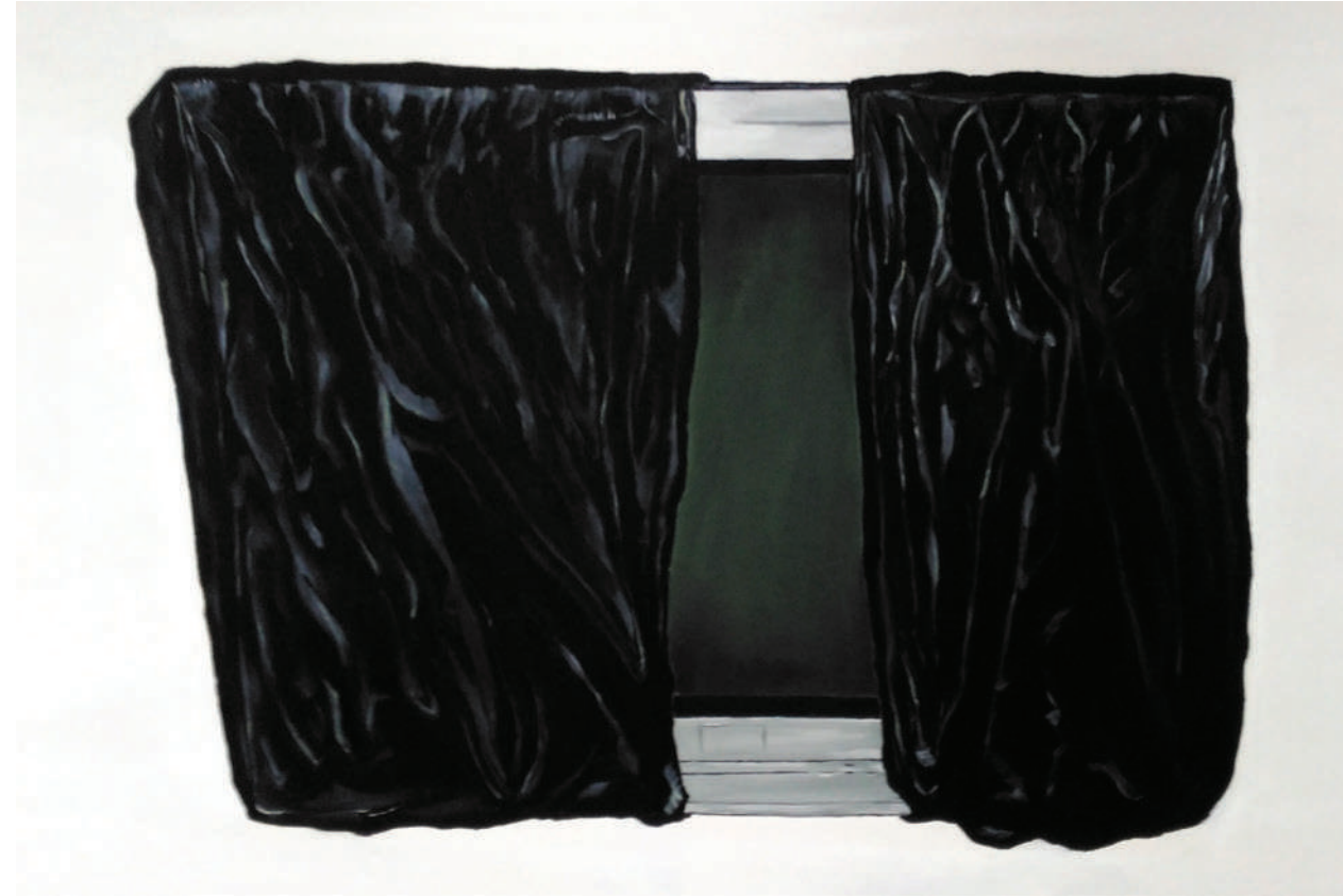
İsimsiz / Untitled, 2017 Tuval üzerine yağlı boya / Oil on canvas, 80 x 120 cm

Having studied painting at Batman University Fine Arts Faculty, Gündüz held her first solo show Polyamide Loop at Batman University Art Gallery in 2017. Some of her group shows are: UPSD Youth Activity 7 - Mirror Mirror, Tell Me: Are We Really Apart? (İstanbul, 2017); Cracking the Glass Ceiling (Batman, Turkey, 2017) and Destpêk-The Beginning (Batman, Turkey, 2015).