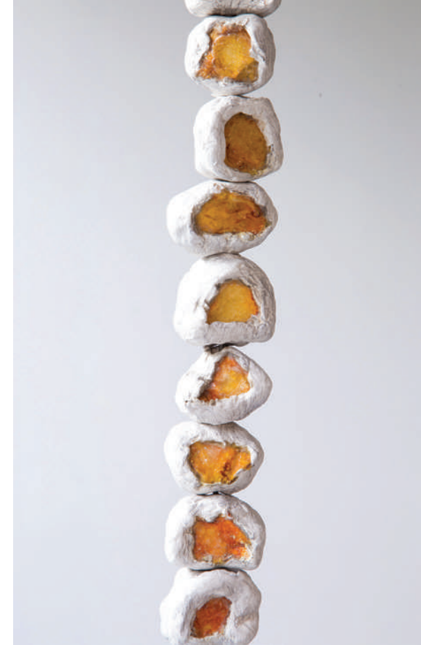
Riegl'in Yolculuğu: Değişken Boyutlarda Çemberler Arasından Riegl's Journey Through Hoops of Varying Sizes, 2017 Yerleştirme; portakal kabukları, el kremi, porselen ve karışık teknik Installation; Orange peels, hand lotion, porcelain and mixed media Değişken boyutlarda / Dimensions variable