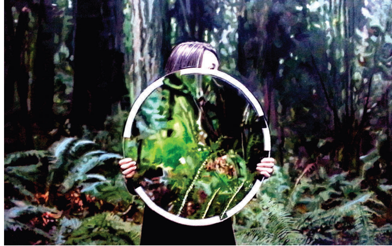
Melankoli / Melancholia, 2016