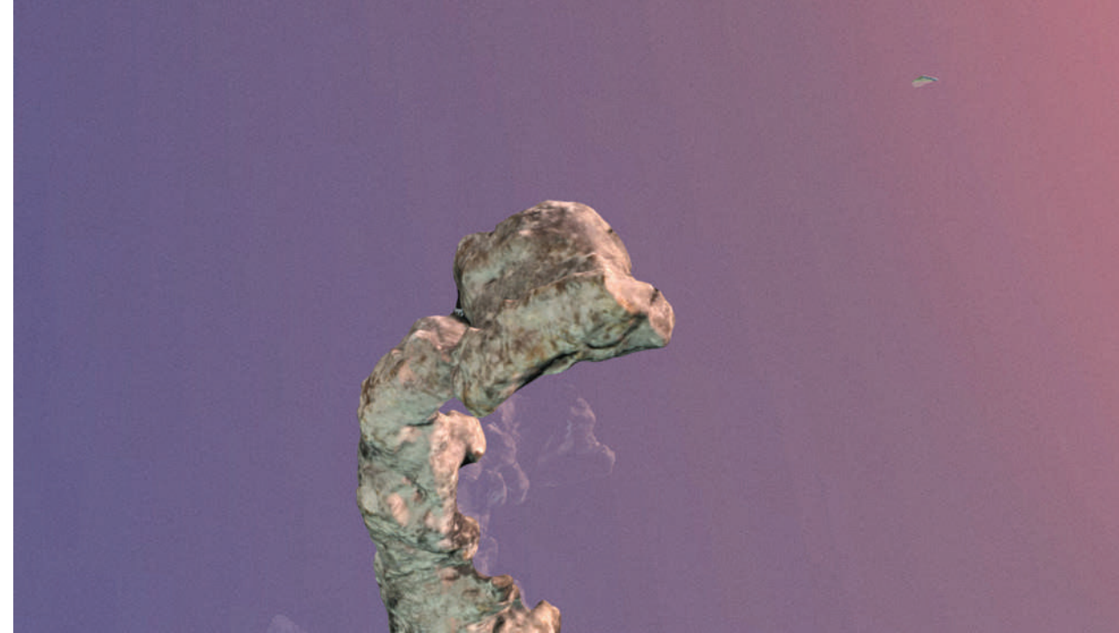
Soyut Şiddet / Abstract Violence, 2016